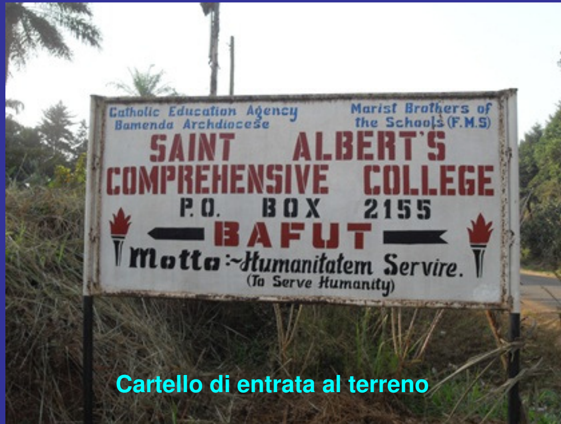
Cartello di entrata al terreno

Per rispondere a questa realtà si costruì il St. Albert's College di Bafut, nella periferia di Bamenda